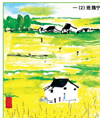
淮师附小山南第十小学 一(2)班 隗宁