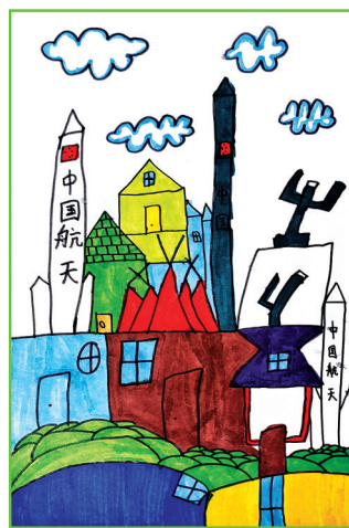
淮师附小山南第十小学 二(2)班 马钰泽

现在回想起来,我非常感谢这本书的作者——德国漫画家埃·奥·卜劳恩。通过这些漫画故事,我不仅感受到了父与子之间的欢乐,也感悟到了他们之间爱的真谛——相互陪伴、共同探索世界,并享受其中的乐趣!我好期望我和妈妈也可以成为这样的“母与女”,在彼此陪伴下环游世界,相亲相爱永不分离!