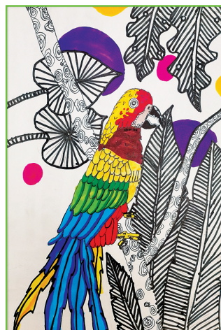
淮师附小山南第十小学 三(3)班 程永馨