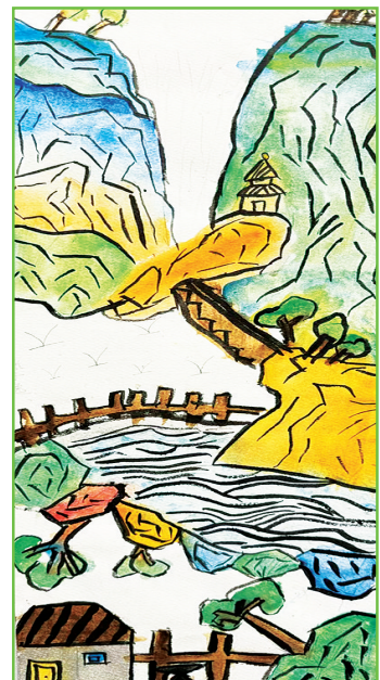
淮师附小山南第十小学 一(1)班 张子逸