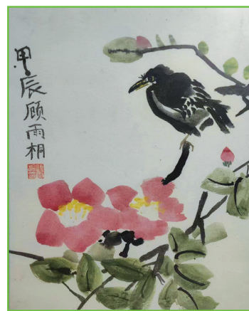
淮师附小山南第十小学 三(1)班 顾雨桐