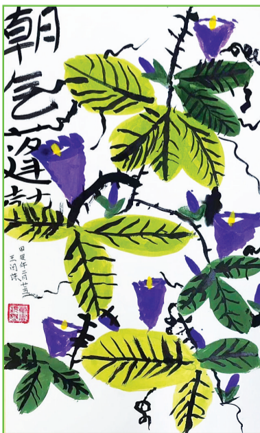
民生中学 二(7)班 王闰萍