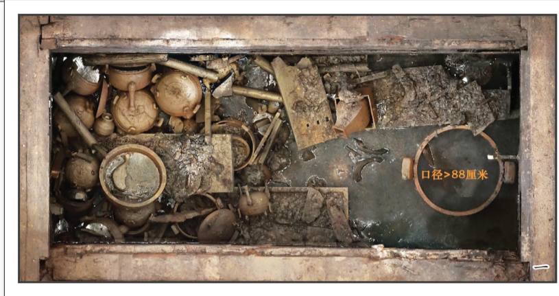
图一:武王墩一号墓大鼎位置(资料图片) 图二:铸客大鼎(资料图片) 图三:武王墩墓考古发掘现场(资料图片)

楚国曾经多么强大? “楚国,曾是春秋战国时面积最大的诸侯国;列国角力时代,从春秋时的晋、楚到战国时秦、楚主导,楚一直留在‘第一梯队’;第一个称王、问鼎中原,试图和周王室平起平坐的是楚国;最先设置县制的是楚国;现在已知的所有先秦的金、银币都出自楚国;春秋战国最先进的青铜冶铸业在楚国,发明了‘失蜡法’技术;最早的铁器在楚国……”专注于“博览古今智识,传承文化之美”的“文博时空”,其作者在独家专访武王墩墓考古领队宫希成后,被武王墩墓深深震撼,泼墨如注,对楚国的辉煌历史进行了制表列单。 楚国800余年历史,曾经迁都6次,最后落于寿春(今淮南寿县),也亡于寿春。可以说,楚国最后的文化绝唱,留在了寿春。 考古发现,曾经不可一世的楚国,在一次次战乱后,以宗庙崩、陵墓毁而走向收尾。至今,唯一能够经过考古确认的楚国王陵,只有葬于淮南李三孤堆的寿春时期的楚幽王墓。而武王墩墓是经科学发掘的迄今规模最大、等级最高、结构最复杂的大型楚国高等级墓葬。宫希成表示,截至目前,如此高等级的楚墓,是个孤例。 那么,武王墩墓对研究楚国文化、