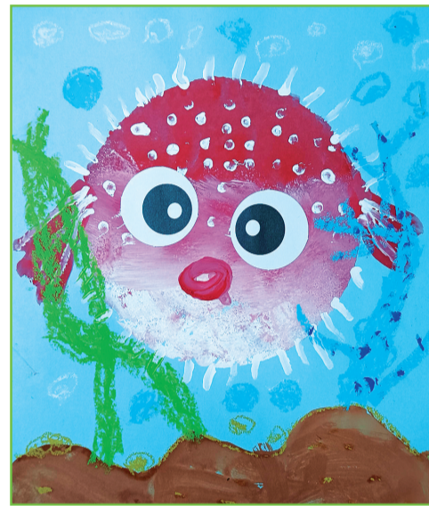
淮师附小本部校区 一(1)班 郎熙然