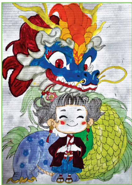
田家庵区第二小学 二(3)班 钟灵毓