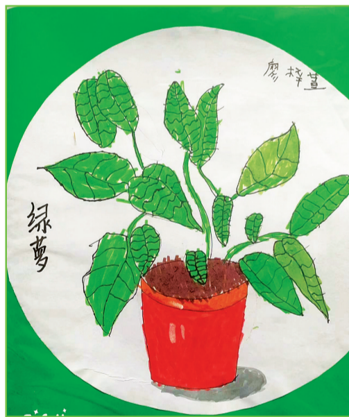
田家庵区第二小学 二(2)班 廖梓萱