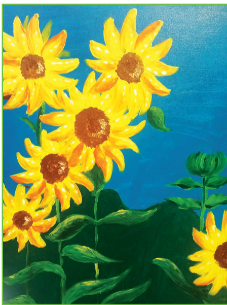
田家庵区第二小学 二(3)班 左靖轩