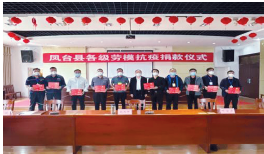
劳模捐款助力抗疫