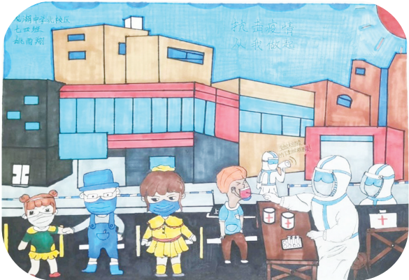
龙湖中学北校区 七(4)班 姚雨翔