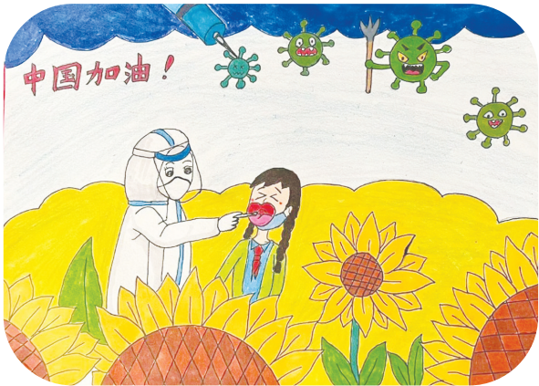
民生中学 三(1)班 邓欣妍

在我看来,抗疫没有“观众席”,人人都是“运动员”。有一份光就发一份热,虽然光亮很小,但也能照亮那方圆之地。 平凡之躯,点滴之力,终将汇聚成磅礴之势。在防疫的紧要关头,献出自己微薄的一点力量,为社会做贡献,也是一件很光荣的事情,这也是当代中学生的责任和使命。点滴微光可成星河,涓滴细流亦汇沧海。我要用行动收获人生的“经验值”,完成赋予自己的“加冕礼”。