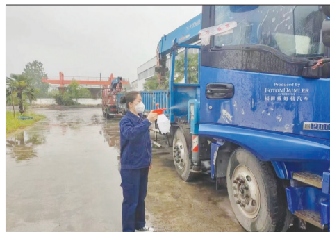
图为淮南中兴实业有限责任公司抓紧生产。

为确保煤矿井下生产,淮南亿万达集团橡塑分公司、矿用设备制造分公司和东浙盛分公司党支部全体干群团结一心,共克时艰。皖北集团朱集西矿急需风筒布,橡塑分公司在做好“送货人员全程不下车、不与任何人接触”的防疫措施下,第一时间将1万平方米风筒布及时送达,解决了客户燃眉之急。4月份以来,公司累计向矿方供应11.5万只编织袋、1500条风筒和2万只隔爆水袋等矿用急需物资,为煤矿安全生产提供了有力保障。“节日期间,我们科学组织工人分批上岗,加强人员的闭环管理,强化重点生产环节的力量保障,大家齐心协力,尽快把因疫情耽误的进度抢回来。”淮南亿万达集团相关负责人说道。