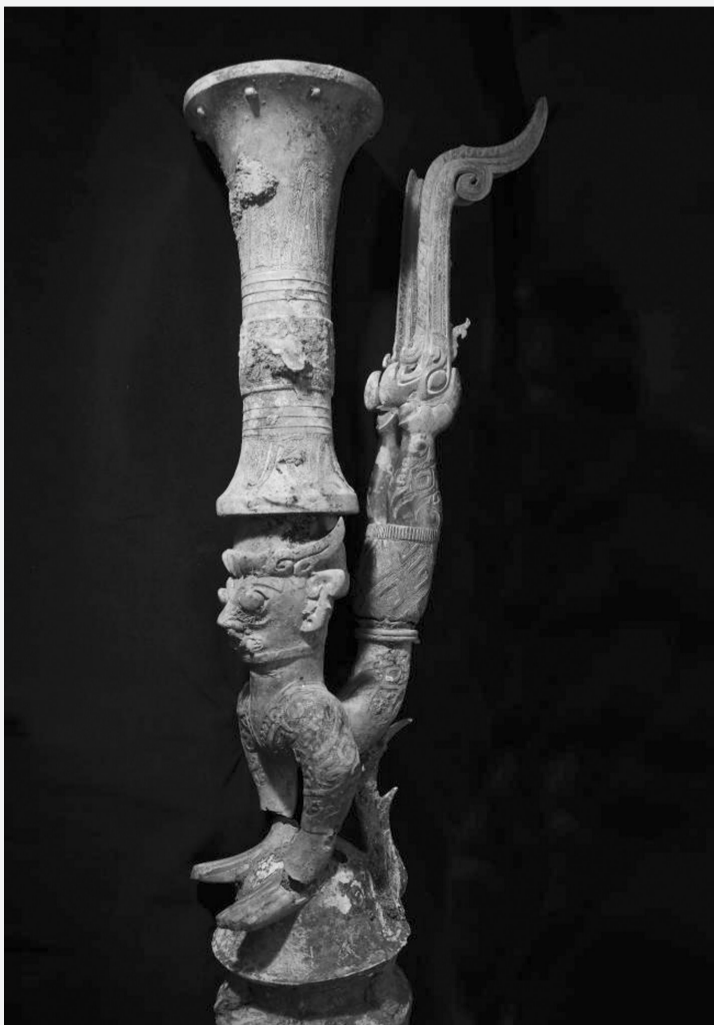
三星堆鸟足曲身顶尊神像

三星堆的考古研究还在持续,考古学家们像找拼图一样,为我们一点点揭示三星堆古国的“庐山真面目”。