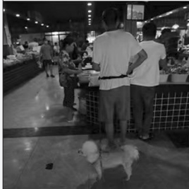
极个别消费者不遵守“犬只禁入”的管理要求