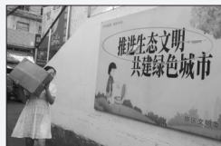
市场内的文明宣传板牌破损