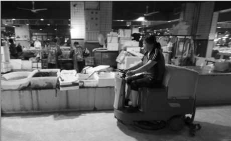
保洁人员来回清扫市场内地面