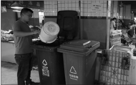
菜市场内设有多个垃圾桶

待，商户在室内将鸡鸭处理完毕后，从窗口递出。 龙湖市场内各条道路干净整洁，在两个多小时的采访中，记者不时能看到市场工作人员开着清洁车或拿着扫帚簸箕来回查看并清扫，保持地面清洁。肉类区域每个摊位下放置了垃圾桶，其中一个水产摊点外地面有污水流出，经营户发现后，很快用拖把将其打扫干净。 采访过程中，记者频频发现商户和市民抽烟现象，有肉类经营户一边挥刀剁肉，一边将烟叼在嘴里。在水产区，一名男性经营户赤膊抽烟，站在工作台内刮着鱼鳞。前来购物的市民中，不时能看到有人一边“吞云吐雾”一边讨价还价，手里夹着烟的同时拎着塑料袋。据记者观察，龙湖市场东门和西门入口均贴有“禁止吸烟”的宣传标志，多个区域的墙壁上也都贴有“创建禁烟环境，享受健康生活”等相关提醒。 穿过市场，从东侧门走出，附近地面划了许多非机动车停车位，但是有不少三轮车随意停放在路边，有的挡住了路口。有市民说：“这里的停车位不够用，只能停在路边。”当记者提出“西门不远处有很多车位供非机动车停放”时，市民表示：“太远了，买菜不方便。”