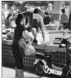
一商户直接踩踏卖肉的铺案出入