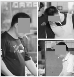
商户在菜市场室内吸烟现象比较普遍