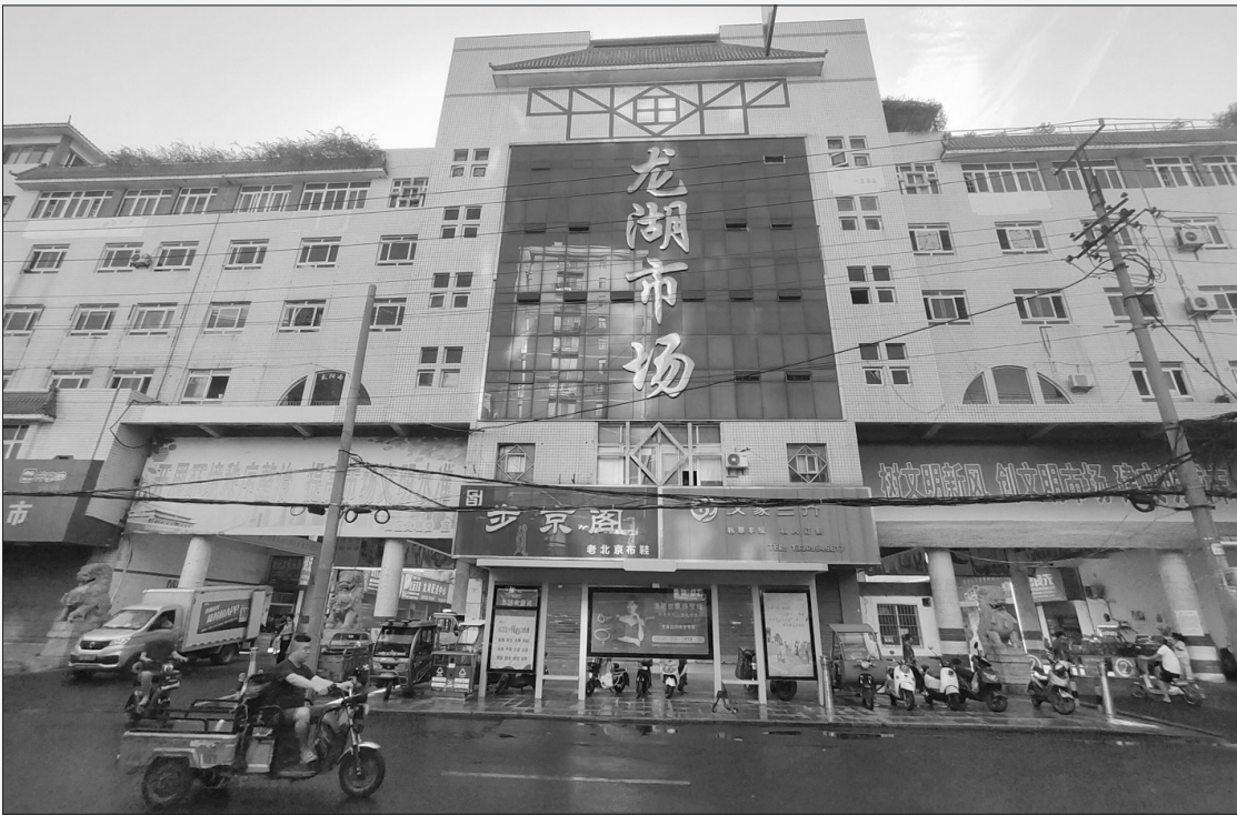
龙湖市场西门口总体环境比较整洁