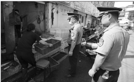
城管人员劝导商户不要占道经营