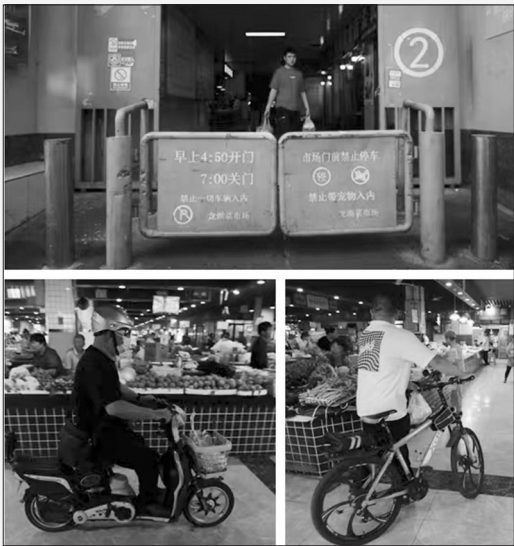
尽管设置了隔挡(上图),仍有市民骑车进入菜市场