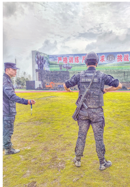
赛场英姿