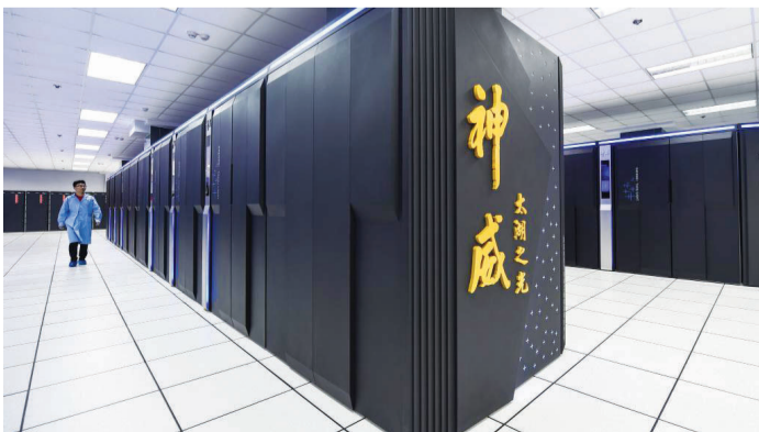
这是2018年10月16日拍摄的安装在国家超级计算无锡中心的“神威·太湖之光”超级计算机。