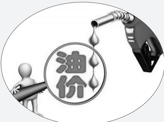
本版图片均为资料片