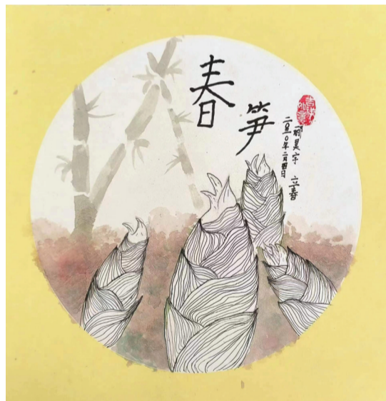
淮南二十六中 三(4)班 郦昊宇