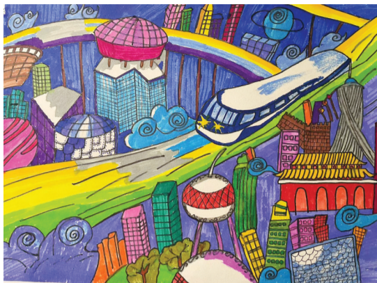
田家庵区第二小学 四(5)班 孙婧熙

后来,还有齐天大圣倒立、山羊走木桥和高空吊环等节目,每个节目都精彩、刺激又惊险有趣。马戏表演结束了,我被演员们的专业精神折服。他们表演的每个节目都有风险,如果失误就会受伤,真是太不容易了。