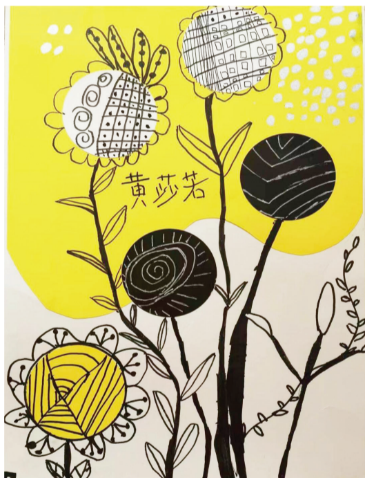
淮师附小本部校区 一(4)班 黄莎若