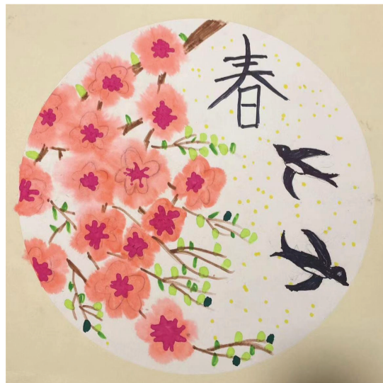
民生中学 四(8)班 邱梓煦