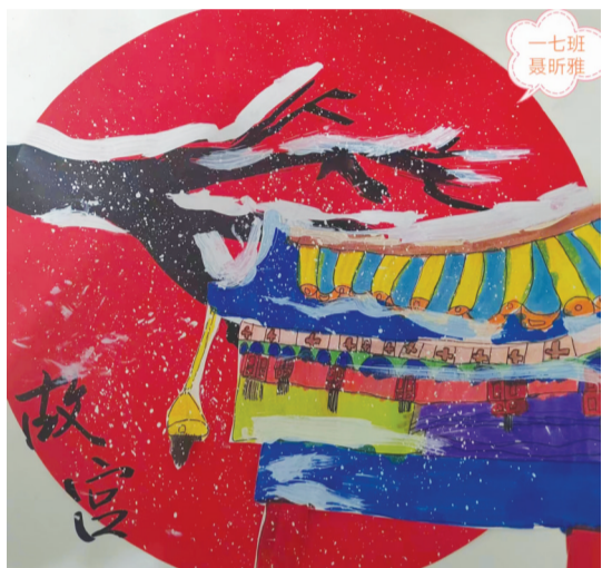
泉山湖中学 一(7)班 聂昕雅