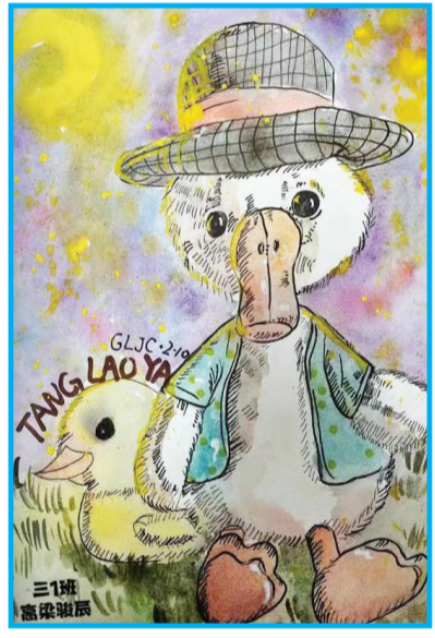
淮师附小山南第十小学 三(1)班 高梁骏辰