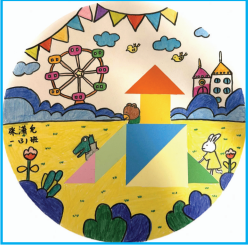
淮师附小山南第十五小学 一(3)班 张潇允