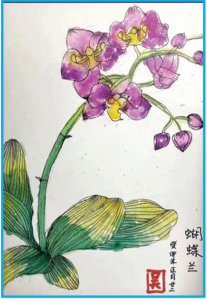
淮师附小山南第十小学 二(1)班 吴越