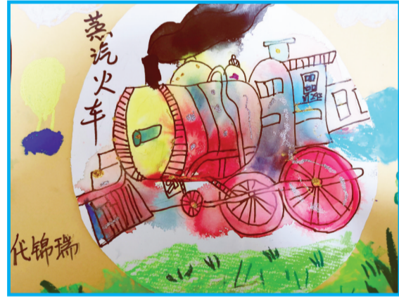
淮师附小山南校区 二(6)班 代锦瑞