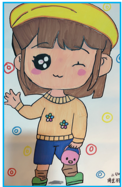
淮师附小山南校区 二(10)班 周芷羽