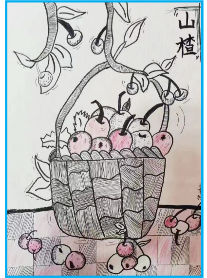
田家庵区第五小学 四(4)班 赵博雅