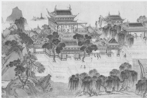
《清明上河图》中描绘出古人庭院内种植柳树等树木