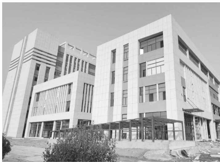
建设中的淮南市高新人民医院

本报讯(记者 廖凌云 摄影报道)3月15日下午,淮南高新区管委会与安徽省公共卫生临床中心(安徽医科大学第一附属医院北区)合作共建淮南市高新人民医院签约仪式举行。这将进一步强化我市基层医疗机构建设,让群众在家门口就能享受到便捷优质的医疗服务,满足人民群众就医需求。