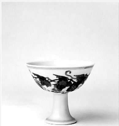
故宫博物院馆藏 明成化斗彩葡萄纹高足杯