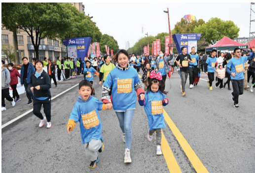
报告显示,2022年浙江省经常参加体育锻炼人口比例达到31.04%,相比于2021年的29.58%,增加了1.46%。

据悉,本年度全民健身活动状况调查工作由浙江省体育局委托浙江师范大学体育与健康科学学院与浙江体育科学研究所实施,调查内容包括居民参加体育锻炼时间、频率、强度和方式,体育锻炼场所和体育消费水平等,调查对象是全省20周岁及以上的人群(不包含学生)。全省共抽取48个县(市、区),根据每个县(市、区)常住人口数同比例确定各自有效样本数,在全省定向定量抽取有效样本34236个。