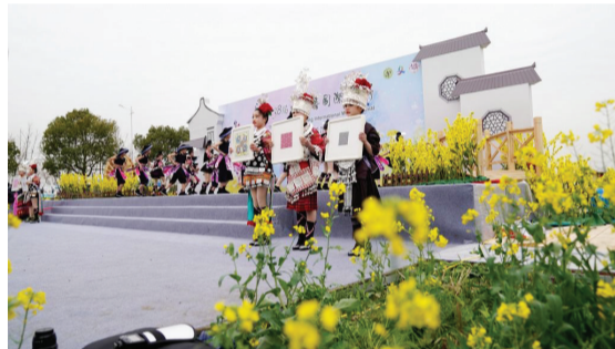
过去几年,上海市百灵鸟少儿艺术团接连邀请了500多位大山里的孩子和他们的老师一起来上海,登上“上海之春”的舞台。

女高音歌唱家李敏唱了一曲《冷江雨巷画中行》,这首袁贤良作词、孔庆禹作曲的公益歌曲,是为庄行镇的古镇冷江雨巷而作。这首歌在网上收获了超过百万的浏览量。男高音歌唱家刘捷压轴登场,演唱了《草原上升起不落的太阳》和意大利作曲家列昂卡瓦洛的名曲《黎明》。