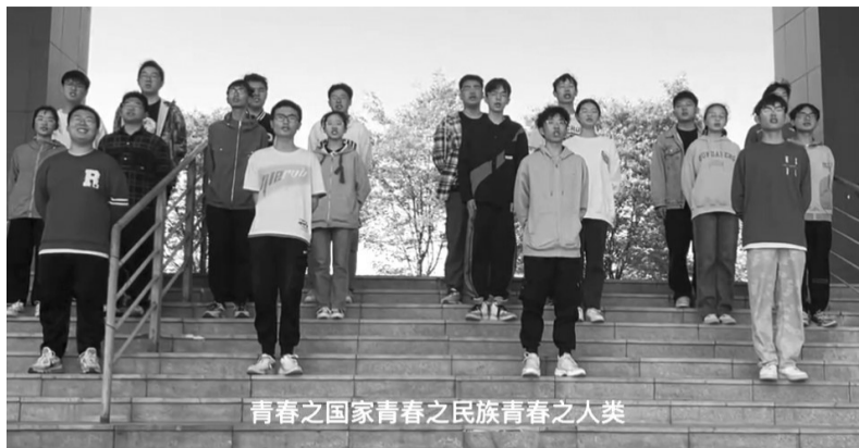
青春之国家青春之民族青春之人类

本报讯(记者 付莉荣 摄影报道)最美人间四月天,与“知”为伴香万卷。4月21日,安徽理工大学第十届“梧桐树下”大学生读书文化节圆满落幕。本届大学生读书文化节由校党委宣传部、校学生处、校团委、校图书馆联合主办,以“阅读新思想,争做新青年”为主题,全校15个学院千余人次参加。