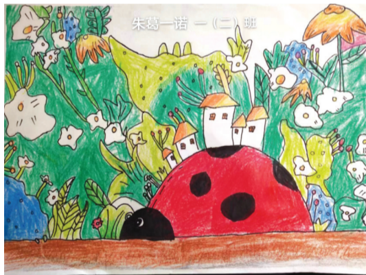
谢家集区第二小学 一(2)班 朱葛一诺