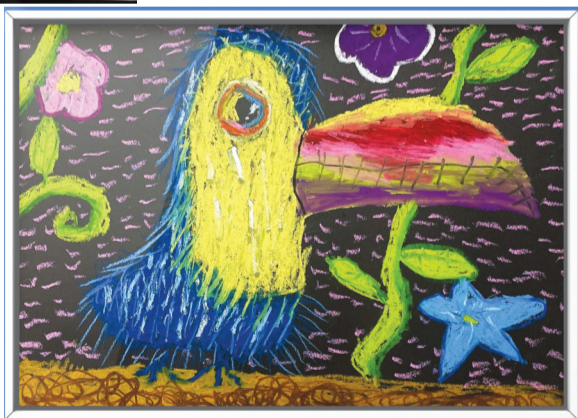
淮师附小本部校区 一(3)班 董沐瑶