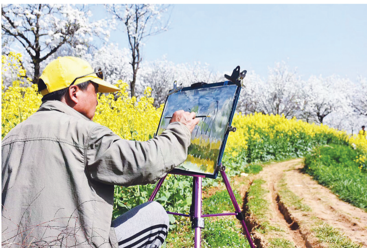
《手绘春天》

柳垂千丝梨花落,常悲清明。今又清明,哀思殇透九泉路,紫燕绕梁蝶逐香。总有归期,今无归期,英灵韵高九天阙。 寿县公安局 刘义全