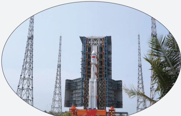
5月7日,天舟六号货运飞船与长征七号遥七运载火箭组合体垂直转运至发射塔架。

据中国载人航天工程办公室介绍,目前,文昌航天发射场设施设备状态良好,后续将按计划开展发射前的各项功能检查、联合测试等工作。