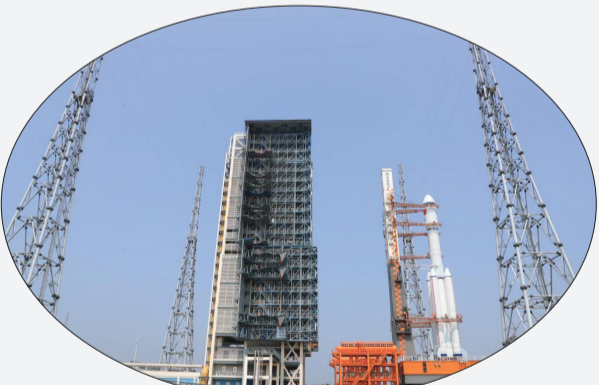
5月7日,天舟六号货运飞船与长征七号遥七运载火箭组合体在垂直转运中。