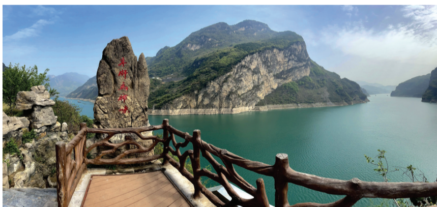
长江三峡之牛肝马肺峡