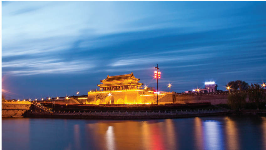
《通泥夏之彩》