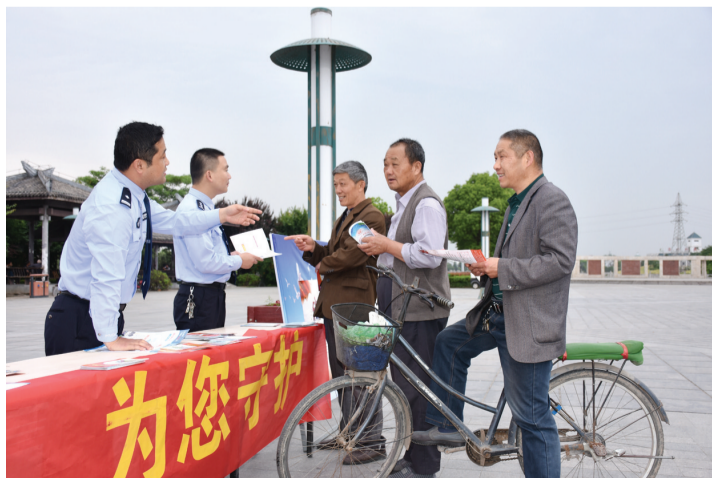
《为您守护》