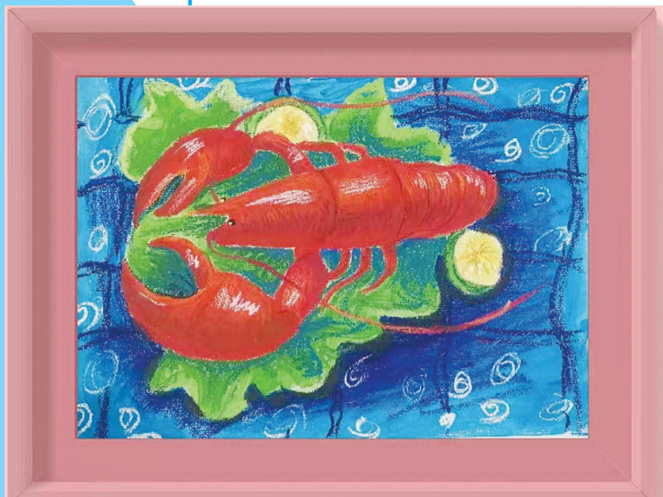
田家庵区第五小学 四(3)班 陈皓轩