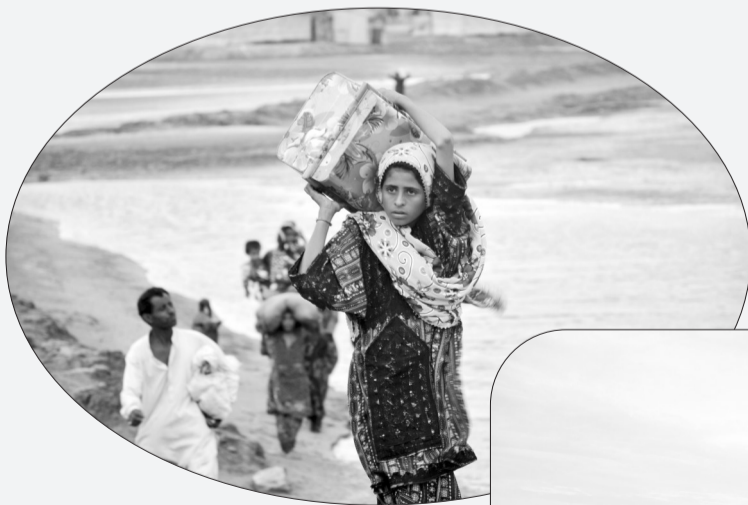
6月13日,受“比帕乔伊”飓风逼近影响,民众从巴基斯坦信德省特达地区撤离。

巴基斯坦国家灾害管理局局长伊纳姆·海德·马利克13日说,为应对“比帕乔伊”飓风,巴基斯坦计划疏散约10万名沿海居民。