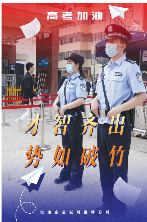
护航高考宣传海报(1) 淮舜分局 芮成杰