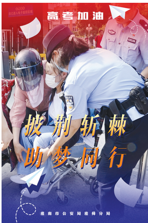
护航高考宣传海报(2) 淮舜分局 芮成杰