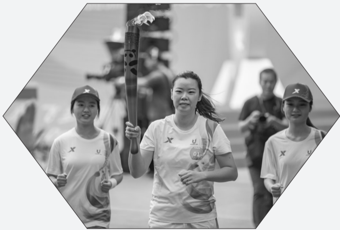
6月24日,火炬手李雪芮(中)在火炬传递中。当日,成都第31届世界大学生夏季运动会火炬传递重庆站在重庆大学举行。