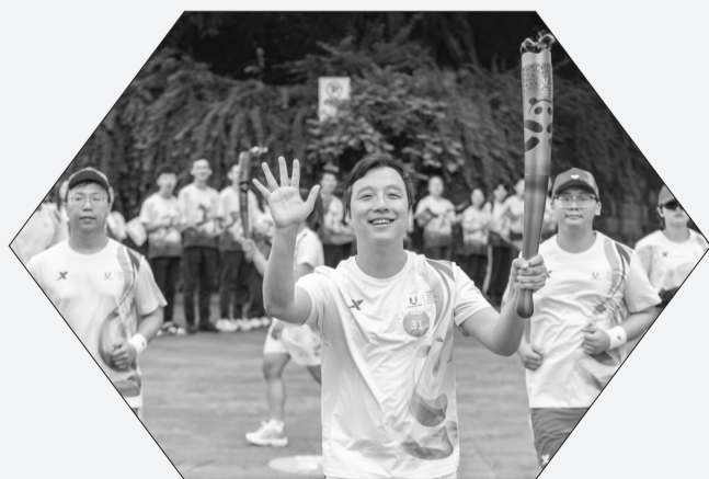
6月24日,火炬手古力(中)在火炬传递中。