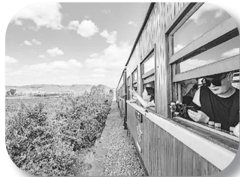
云南省建水县、石屏县小火车旅游专列陆续营运,成了新旅游线路,吸引不少游客前来体验。