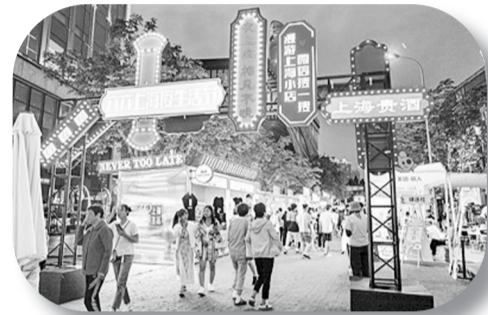
上海市夜生活节于6月初启幕,市民和游客参与体验。