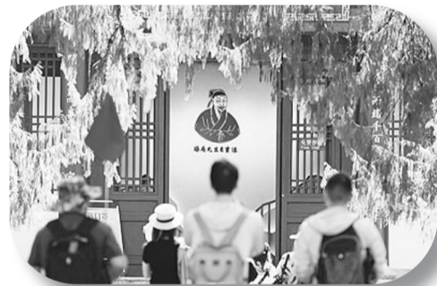
游客参观福建省武夷山朱熹园武夷精舍。