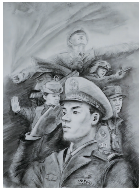
绘画 淮舜分局丁关派出所 王晶