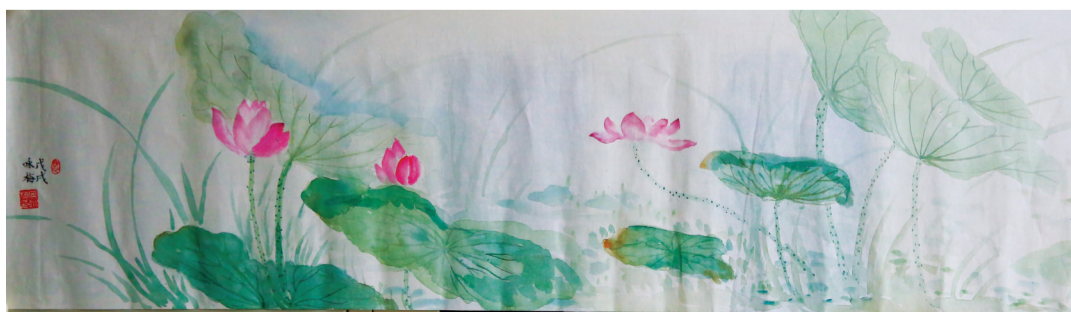
绘画 清莲 淮南市公安局 陈咏梅