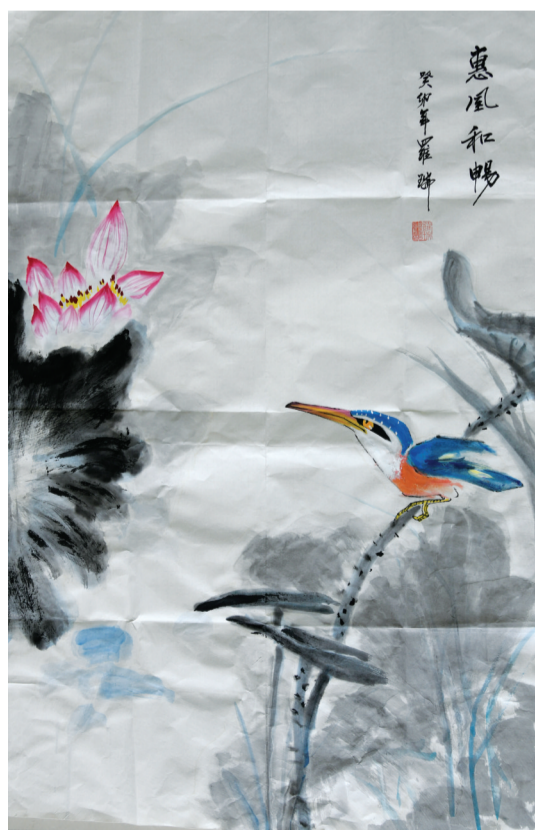
绘画 田家庵分局 罗瑞