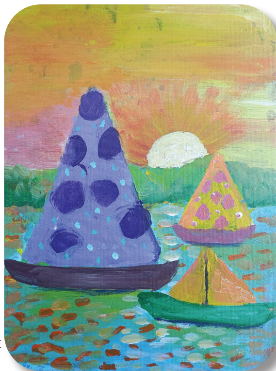
淮师附小山南 第十六小学 二(4)班 苏怀瑾