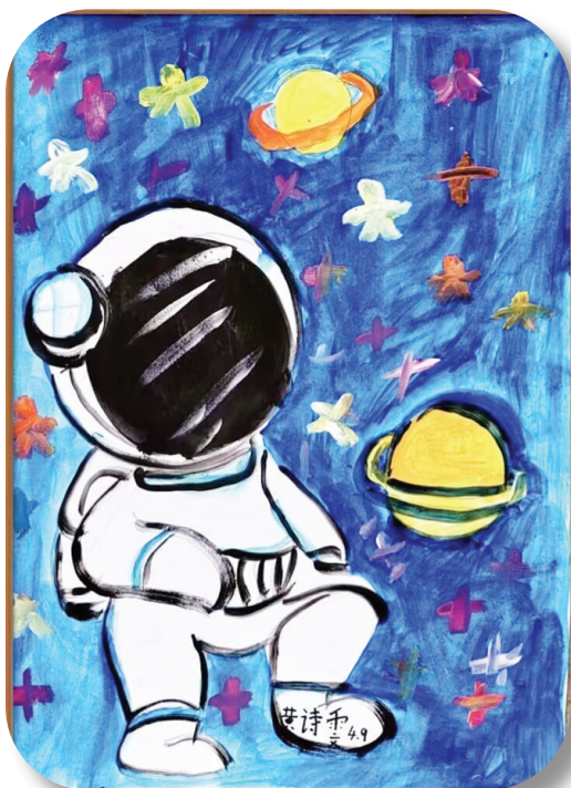
洞山中学 一(5)班 黄诗雯