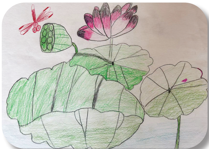
民生中学 二(12)班 姚若雪