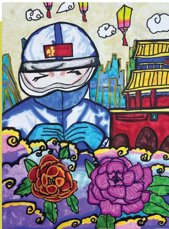
淮师附小山南校区 二(12)班 邹弈轩