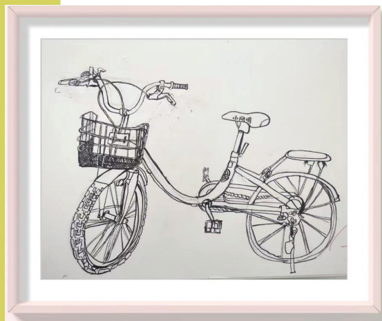
田家庵区第十八小学 四(3)班 江乐童