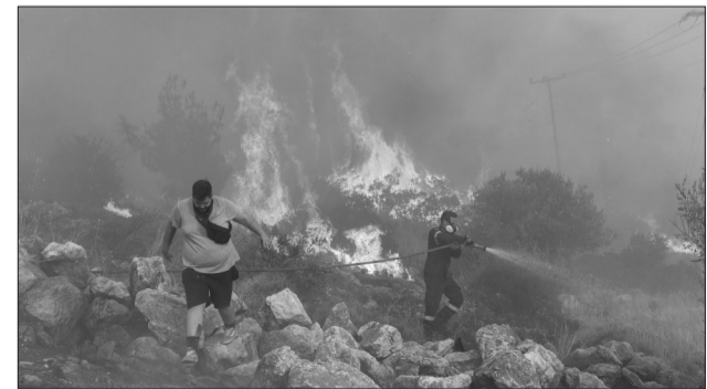
8月22日,消防员在希腊首都雅典附近的查西亚村灭火。希腊雅典通讯社报道说,希腊境内目前共有65处在燃野火,其中两处位于首都雅典所在的阿提卡大区,欧洲多个国家派出消防人员支援希腊的灭火行动。该国东北部亚历山德鲁波斯地区受野火影响严重,已导致至少18人死亡。