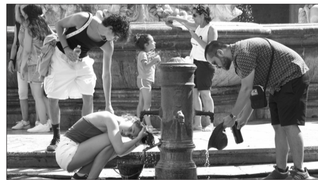
8月22日,人们在意大利罗马的一处水龙头冲凉。当日,意大利卫生部对包括首都罗马在内的16个城市发布高温红色预警。