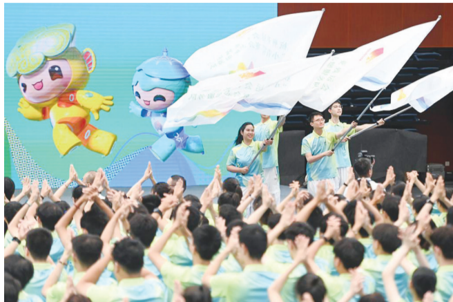
杭州亚运会、亚残运会赛会志愿者在出征仪式上

从2016年G20杭州峰会开始,身着青绿、洋溢青春,代表西子湖畔城市形象的志愿者们有了一个形象的呢称——“小青荷”。