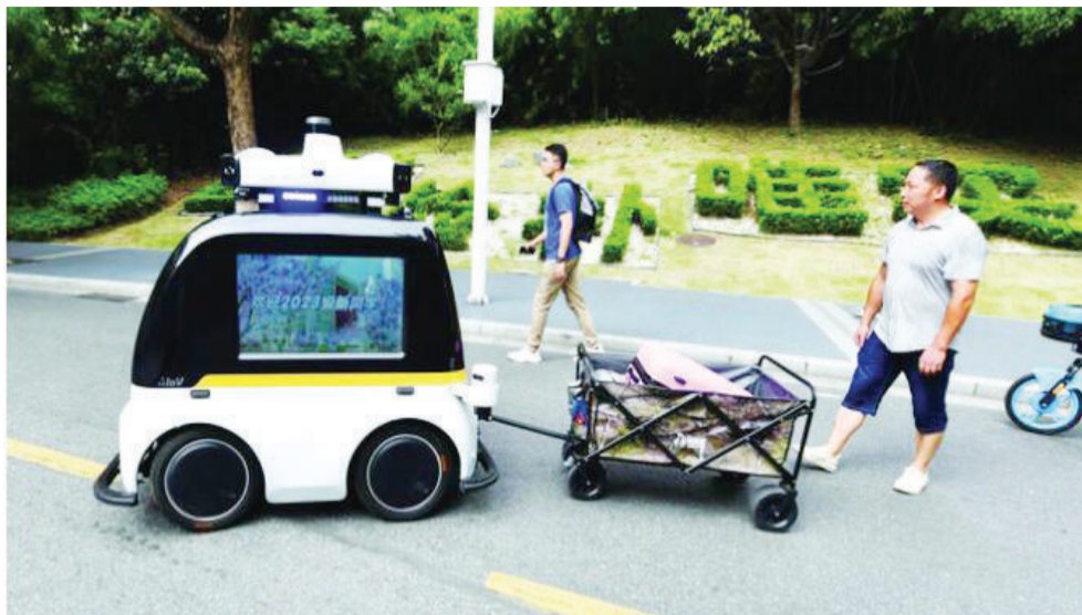
运送行李的无人驾驶车

8月27日-28日是南航2023级新生报到的日子。为了迎接05后“萌新”,南航校园焕然一新,就连运送行李都用上了无人车队。