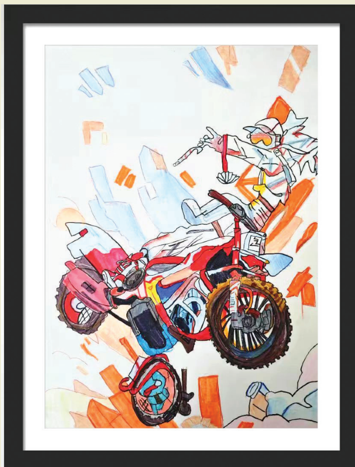
田家庵区第五小学 三(4)班 姚雨涵