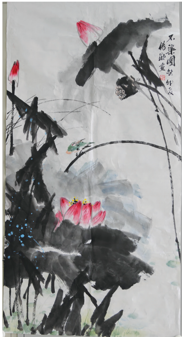
国画《不染图》(浦集公安分局 杨珑)