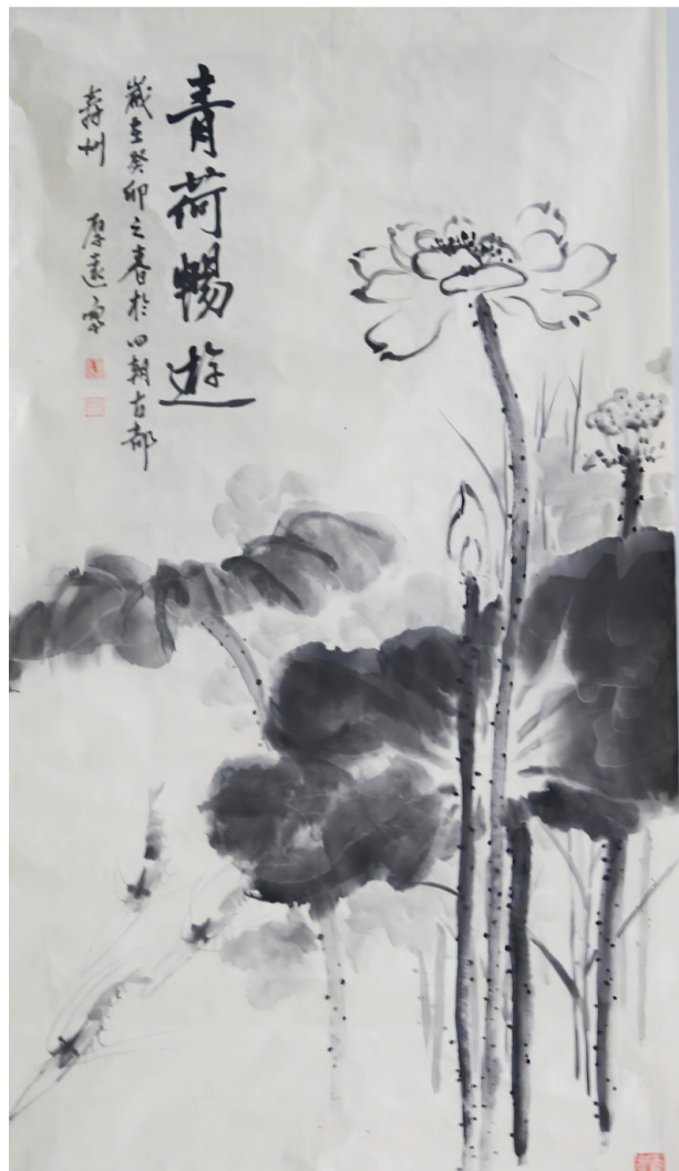
国画《青荷畅游》(寿县公安局 葛厚远)