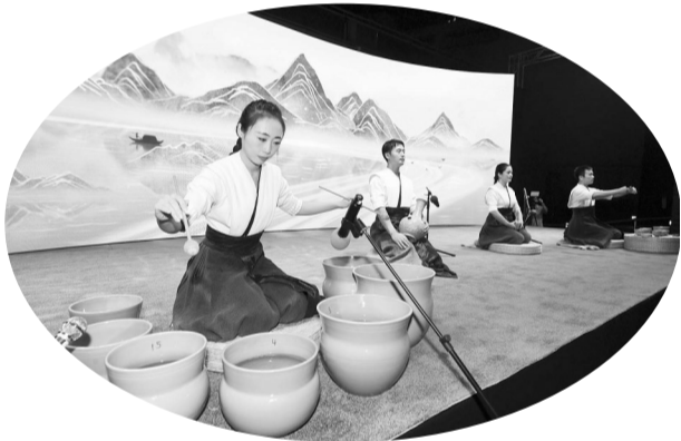
中国演员在表演节目