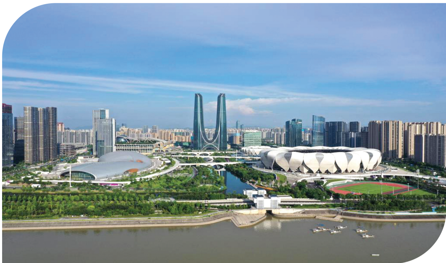
这是2023年6月28日拍摄的杭州奥体中心体育场馆群(无人机照片)。

形如手握薪柴、身着金紫双色,既蕴藏良渚文化又科技范十足的“薪火”火炬,于20日传回浙江杭州。23日,“亚运之光”将照亮这座有着“人间天堂”美誉的焕新古城。