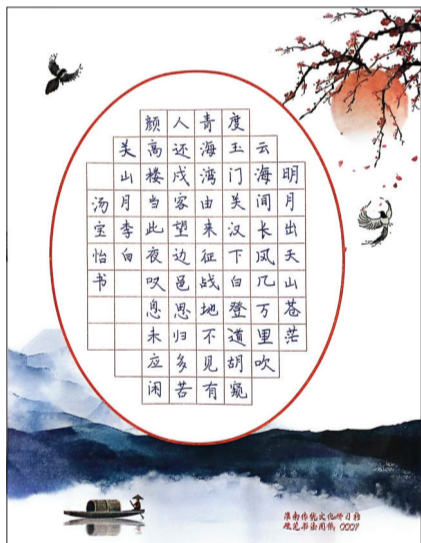
洞山中学 四(1)班 汤宝怡