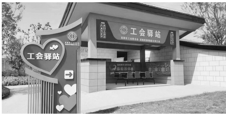
淮南高新区工会驿站,站内配备统一的标牌标识。

本报讯12月11日,淮河早报、淮南网记者从淮南市总工会获悉,全国总工会发布了2023年“最美工会户外劳动者服务站点”(简称最美驿站)名单,全国2000个工会驿站被确认为2023年最美驿站。其中,淮南市上榜3个,分别是淮南高新区工会驿站、寿县高铁站综合管理服务中心工会驿站和淮南市新时代工会驿站。