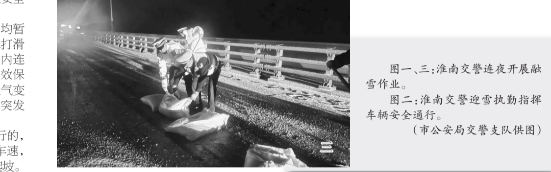
图一、三:淮南交警连夜开展融雪作业。