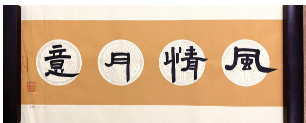
淮南十九中 一(1)班 杨静轩