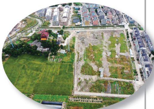
章安故城遗址现场