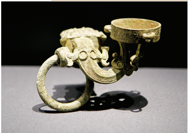
战国时期的曲龙纹异形铜构件