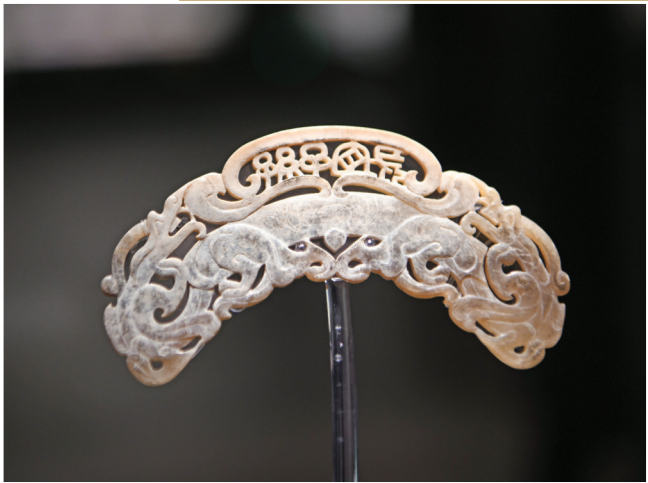
东汉时期的透雕“长宜子孙”双龙璜形玉佩