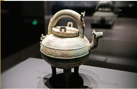
春秋时期的龙首提梁铜盂