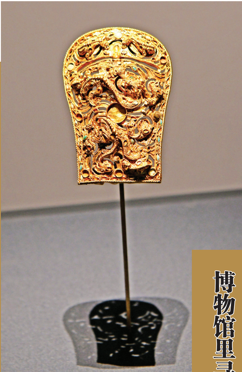
东汉时期的累丝镶宝八龙纹金带扣