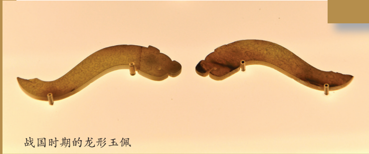
战国时期的龙形玉佩