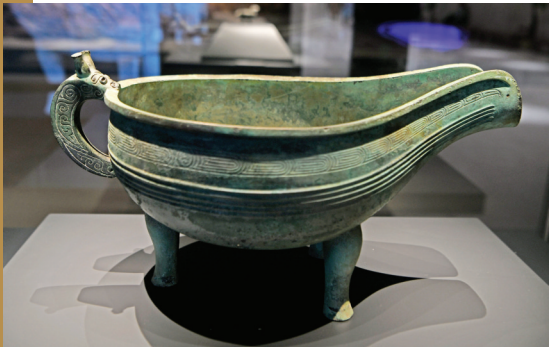
春秋时期的重环纹龙首扳三足铜匜