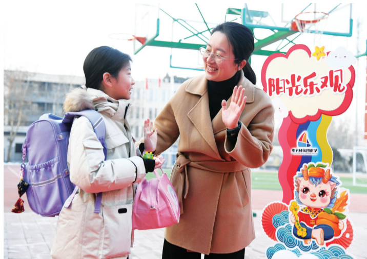
2月26日,在北京市海淀区中关村第四小学,学生与老师相互问候。当日,全国多地中小学开学,师生迎接新学期的开始。