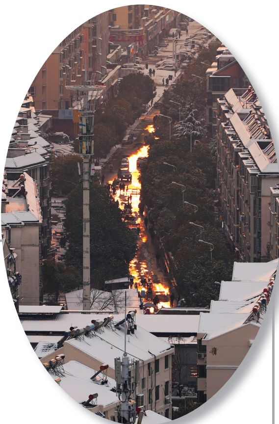
雪后夕阳斜照街面像镀了一层黄金