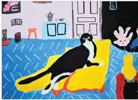
田家庵区第十七小学 五(6)班 朱子墨