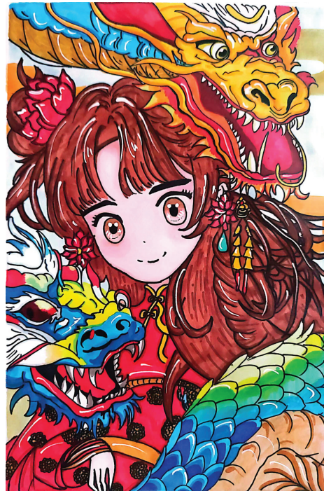
民生中学 四(5)班 荣韵馨